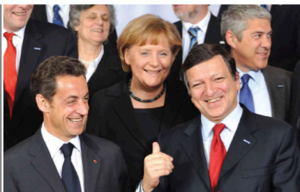
A TURNING POINT FOR THE PLANET? French President Nicolas Sarkozy, German Chancellor Angela Merkel and Danish Prime Minister Lars Løkke Rasmussen celebrate the historic Copenhagen Climate Summit.